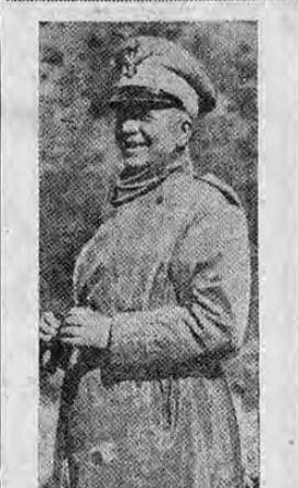
El mariscal Pietro Badoglio, nuevo comandante en jefe de las fuerzas italianas en el norte de Etiopía, en el momento que hacia su primera inspección del frente.

Con motivo de haber sido comprobada su participación en un movimiento revolucionario