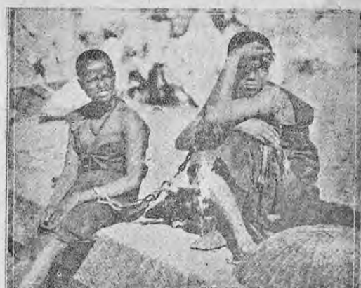
No son exactamente cadenas de amor que unen a estas dos jóvenes etiope, sino que el grabado muestra una acreedora y su deudora encadenadas juntas hasta que la última pague lo que debe a la anterior. Será una caja de polvos?

Thomas Gage venía de una distinguida familia inglesa. Principió su carrera eclesástica en un colegio jesuita en España y su término entrado en el orden de los Américanos. Como clérigo salió de España rumbo a América, pasando doce años de su vida en